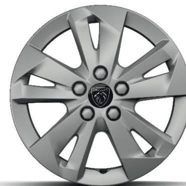
ALLURE - Option

Stahlfelgen 16'' mit Radzierkappen TONGARIRO