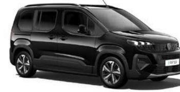
Perla Nera Schwarz